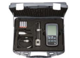
TESA myFinder Set 31