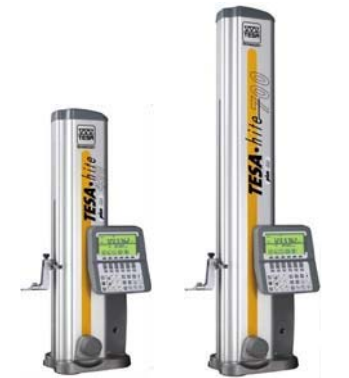
TESA-HITE 400 TESA-HITE 700