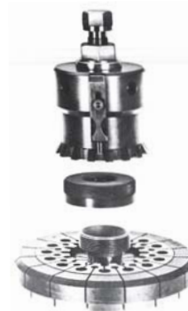
Plate type "Standard", cone, nut and key

Plateau type "standard", cône, écrou et clé de démontage