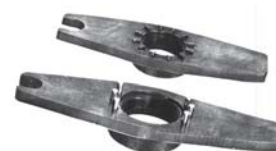
Mitnehmer entraîneurs drivers